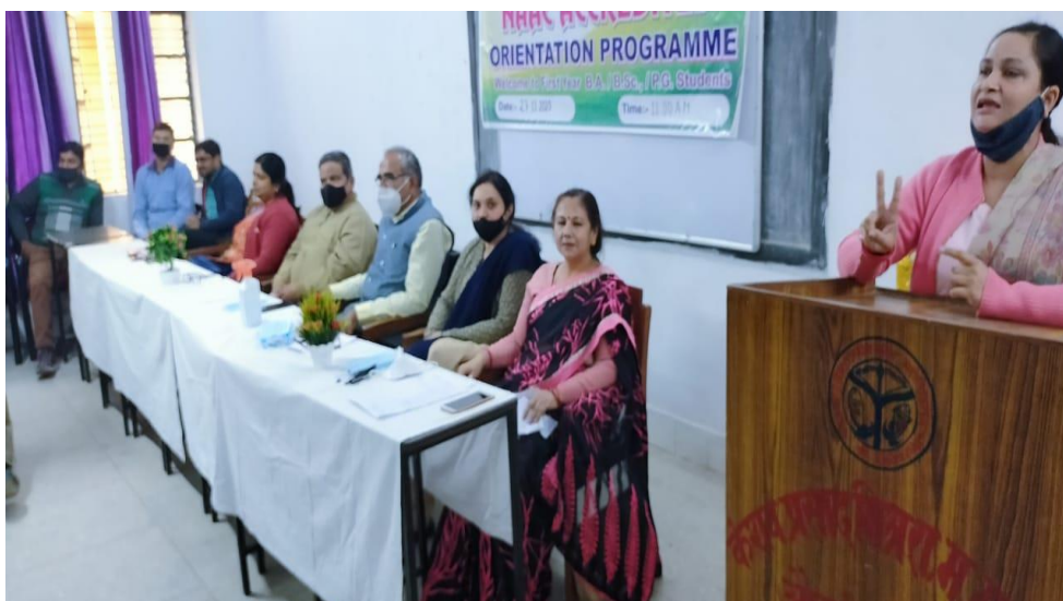
ORIENTATION PROGRAM (27.11.2020)